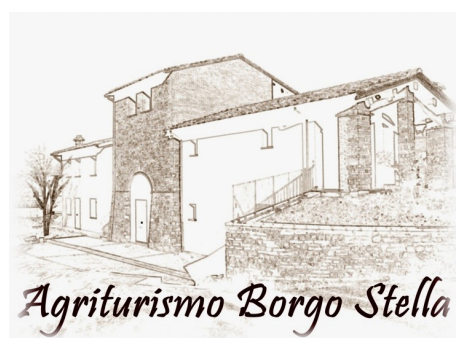
Agriturismo Borgo Stella